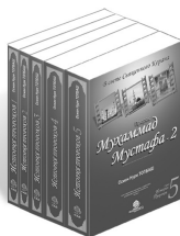
История Пророков - 1, 2, 3, 4, 5