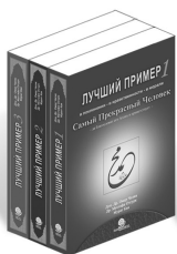
Лучший Пример - 1, 2, 3